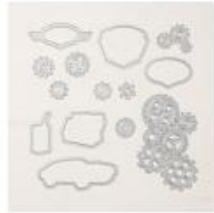
Garage Gears Dies [148521]