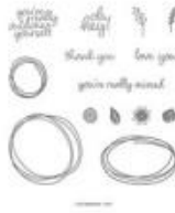
Sweetly Swirled Photopolymer Stamp Set [149254]