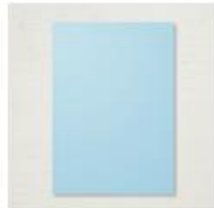
Balmy Blue A4 Cardstock [147007]