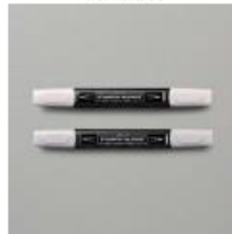
Gray Granite Stampin' Blends Combo Pack [149537]