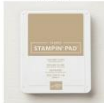
Crumb Cake Classic Stampin' Pad [147116]