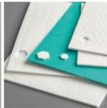
Mini Stampin' Dimensionals [144108]