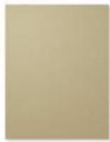
Crumb Cake A4 Card Stock [121685]