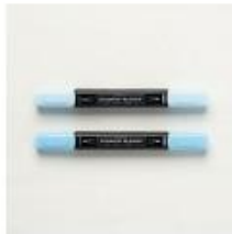
Balmy Blue Stampin' Blends Combo Pack [148544]