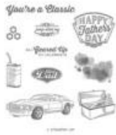
Geared Up Garage Cling Stamp Set [148590]