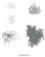
Artisan Textures Clear-Mount Stamp Set [146573]