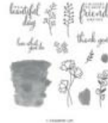
Love What You Do Photopolymer Stamp Set [148042]