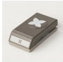
Four-Petal Flower Punch [147041]