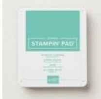
Coastal Cabana Classic Stampin' Pad [147097]