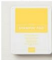
Daffodil Delight Classic Stampin' Pad [147094]