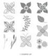
Pop Of Petals Clear-Mount Stamp Set [146649]