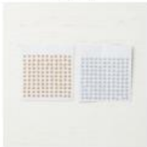
Metallic Pearls [146282]