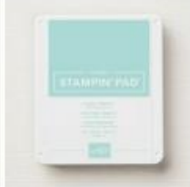
Pool Party Classic Stampin' Pad [147107]