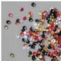
Peaceful Poppies Sequins [151525]