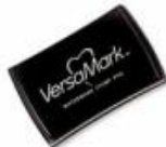
VersaMark Pad [102283]