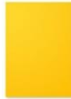
Card Stock A4 Crushed Curry [131288]