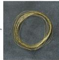
Gold Metallic Thread [138401]