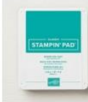
Bermuda Bay Classic Stampin' Pad [147096]