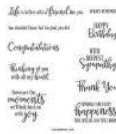
Peaceful Moments Cling Stamp Set (English) [151595]