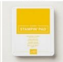
Crushed Curry Classic Stampin' Pad [147087]