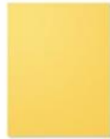
Daffodil Delight A4 Card Stock [121680]