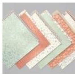
Gilded Autumn Specialty Designer Series Paper [153520]