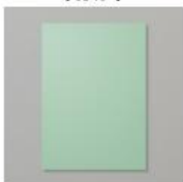
Mint Macaron A4 Cardstock [138344]