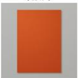
Cajun Craze A4 Card Stock [121685]