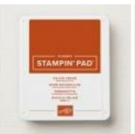
Cajun Craze Classic Stampin' Pad [147085]