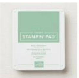
Mint Macaron Classic Stampin' Pad [147106]