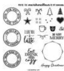
Warm Hugs Photopolymer Stamp Set (English) [155478]