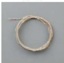
Linen Thread [104199]