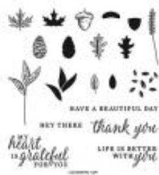
Beautiful Autumn Photopolymer Stamp Set [155450]