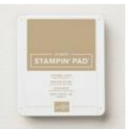
Crumb Cake Classic Stampin' Pad [147116]