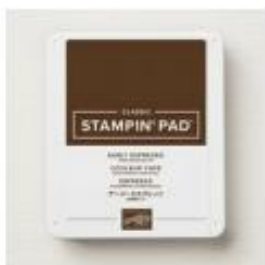
Early Espresso Classic Stampin' Pad [147114]