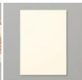
Very Vanilla A4 Card Stock [106550]