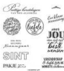
Cadeauseizoen Cling Stamp Set (Dutch) [154910]