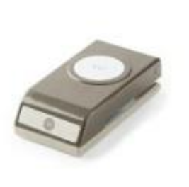
1-1/2" (3.8 Cm) Circle Punch [138299]