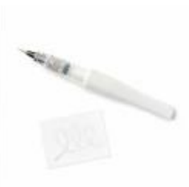
Clear Wink Of Stella Glitter Brush [141897]