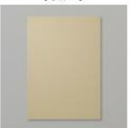
Crumb Cake A4 Card Stock [121685]