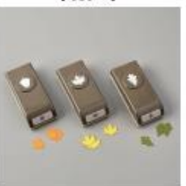
Autumn Punch Pack [153609]