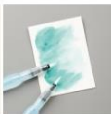
Fluid 100 Watercolor Paper [149612]