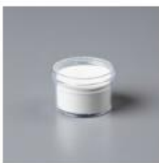
White Stampin' Emboss Powder [109152]