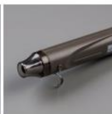
Heat Tool - Eu Plug [129055]