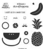
Cute Fruit Photopolymer Stamp Set [155301]