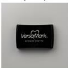
VersaMark Pad [102285]