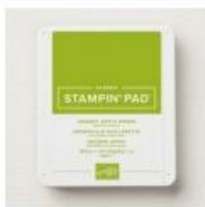
Granny Apple Green Stampin' Pad [147095]