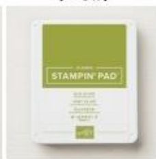
Old Olive Classic Stampin' Pad [147090]