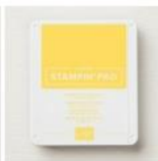
Daffodil Delight Classic Stampin' Pad [147094]