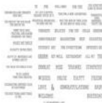
Well Said Cling Stamp Set [148796]