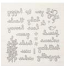
Well Written Dies [148534]