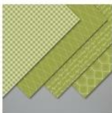
Regals 6" X 6" (15.2 X 15.2 Cm) Designer Series Paper [149616]