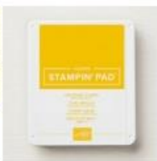
Crushed Curry Classic Stampin' Pad [147087]